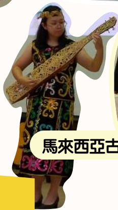
馬來西亞古典樂器演奏