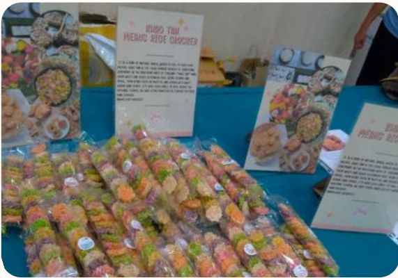
2023 AOC 活動中的泰國小食

泰國G.B.於新加坡G.B.協助下開展，一直專注培育女孩子工作，及後，有愈來愈多家庭希望男孩子得到培育，故泰國G.B.開展了Young Men's Brigade，為當地男孩提供更多發展機會。G.B.及YMB共同隸屬Evangelical Fellowship of Thailand，各自有執行委員會。YMB只有男隊員，G.B.只有女隊員。