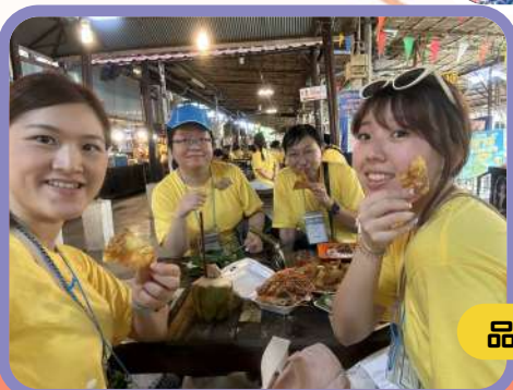
品嘗大牌檔的地道美食