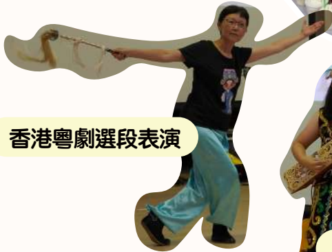
香港粵劇選段表演