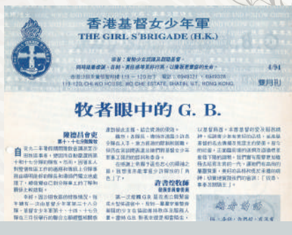
G. B. News 1994-1997

感謝上主鴻恩，G. B. 早就洞觸先機，於1994年開始發展文字工作。初期，以雙月刊方式出版。1997年，改以通訊Newsletter方式取代。由於屬早期文字工作，刊物一律單色印刷。內容方面，以發放內部資訊為主，例如總部消息、活動花絮介紹等。