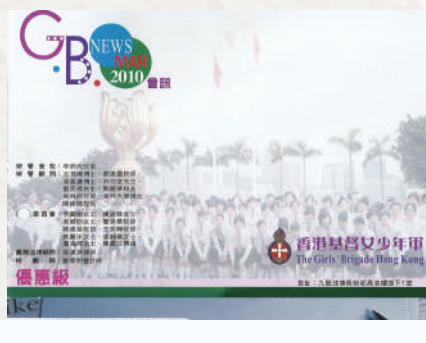
G. B. News 2008-2015

2016年，G. B. 文字工作展開了新的一頁。《珍·言》以A5四頁的篇幅，作主題式介紹，為參與不同事工的人士提供一個分享平台，從而深化各項活動的成果。《珍·言》的出現，使G. B. 文字工作更具活力，同時擴闊內外的接觸面，為機構未來發展鋪路。