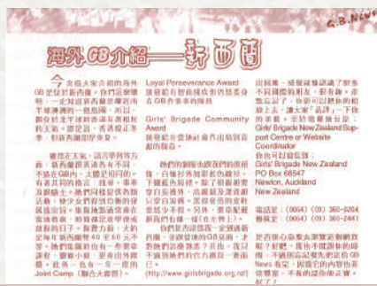
G. B. News 1999-2007

1999年，文字工作進入常規化，每年定期製作G. B. News。起初，仍屬單色，直到2001年改為雙色印刷，意味著文字工作向前邁進一大步。內容方面，加入隊員分享及分隊介紹，大大促進總部與分隊的連繫。隨著刊物製作日趨成熟，2008年，終於出現彩色印刷，增加對讀者的吸引力。