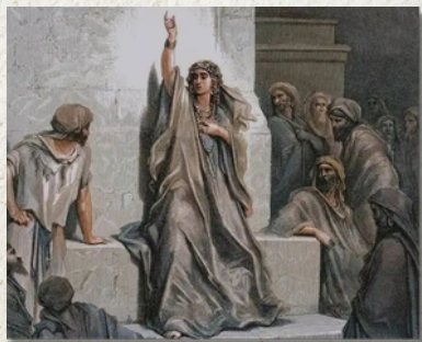
此圖為法國藝術家 Gustave Doré 於約1866年創作，描繪了底波拉在眾人面前宣告上帝的旨意，展現了她的領導力與先知形象。